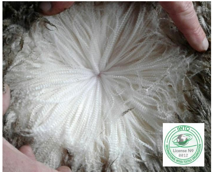
Figura 2. Lana de animales del CRILU con certificación IWTO.

Por otra parte, desde 2015 el CRILU, INIA y LATU llevan a cabo un proyecto denominado “ Caracterización de las propiedades textiles y del contenido de pesticidas para diferenciar y agregar valor en las lanas ultrafinas y superfinas del Uruguay ”, que tiene como objetivo caracterizar los valores de calidad y contenido de pesticidas en las lanas superfinas y ultrafinas generadas en los predios de los productores consorciados. El proyecto plantea la coordinación, complementación y fortalecimiento de las capacidades técnicas, de infraestructura, de gestión, etc entre INIA, LATU y CRILU para mejorar la diferenciación y el valor agregado de este tipo de lanas.