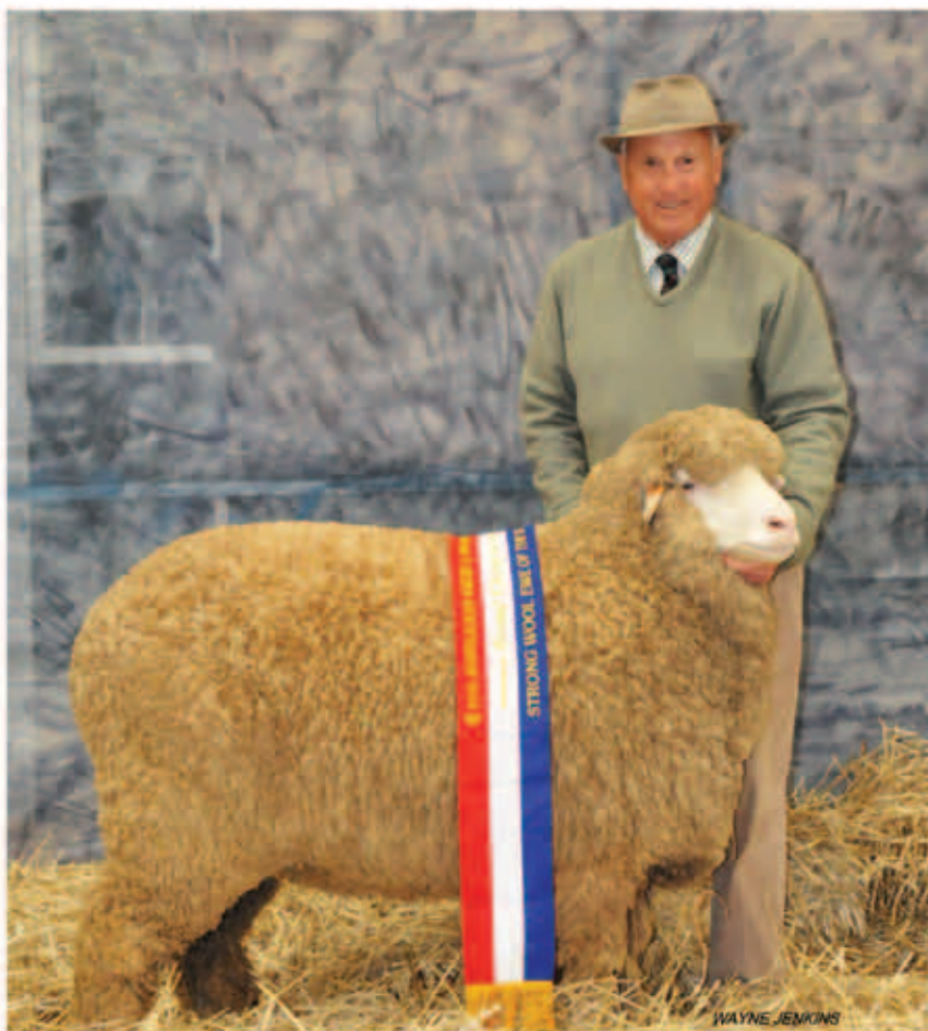
Greenfields Champion Strong Wool & Supreme Champion ROYAL ADELAIDE SHOW