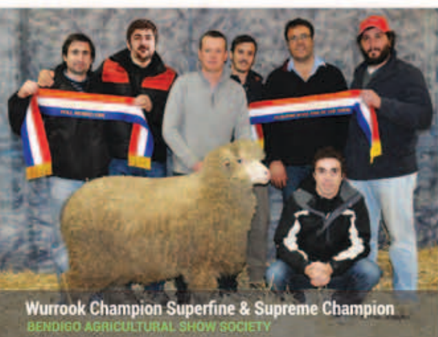
Wurrook Champion Superfine & Supreme Champion BENDIGO AGRICULTURAL SHOW SOCIETY