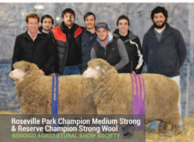
Roseville Park Champion Medium Strong & Reserve Champion Strong Wool BENDIGO AGRICULTURAL SHOW SOCIETY