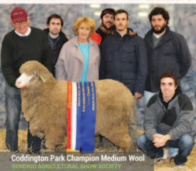
Coddington Park Champion Medium Wool BENDIGO AGRICULTURAL SHOW SOCIETY